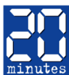
20 Minutes, France